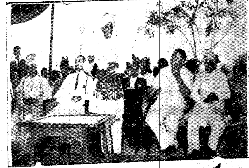
سلطان لحج يخاطب بين الجبر سيجر الى اليمن والمتر ولس الى اليسار

مدينةكم بالتشجيع والتأييد والولاء ، وذلك كله يحفزنى على ان اكرس كافة جهودى لامدادكم واعمل دائماً وابدأ اصالح البلاد وسلاحيكم . . وانى كما عاهدتمونى على الطاعة والولاء ، لأعاهدكم على العمل الدائب في سبيل الاصلاح ، وعلى الحكومة البريطانية فقد التى بالبرية . لقاء