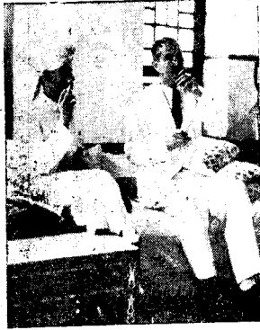
السلطان في حديث مع الجبر سيجر التي تترى سبيل للتقدم والرقى ثم جاء في خطاب مندوبى الحكومة البريطانية :

سيستقبل عظمة سلطان لحج رسمياً في دار الحكومة بمسد في ١٨ جولاى ( بعد غد ) في الزيارة الرسمية التقليدية التي يقوم بها كل سلطان جديد على لحج ومن الفروض ان يرد حاكم مدن اسطان لحج هذه الزيارة بعد ذلك .